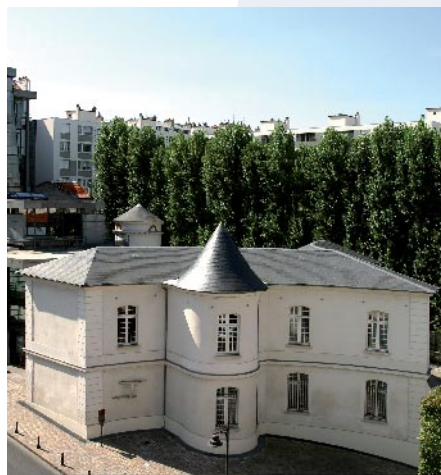
Musée Français de la Carte à Jouer